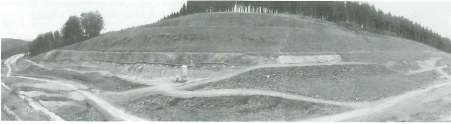
Sanierung eines Rutschhangs an der A46 bei Uentrop Stabilization of a Rockslide, Highway A46, Uentrop, Germany