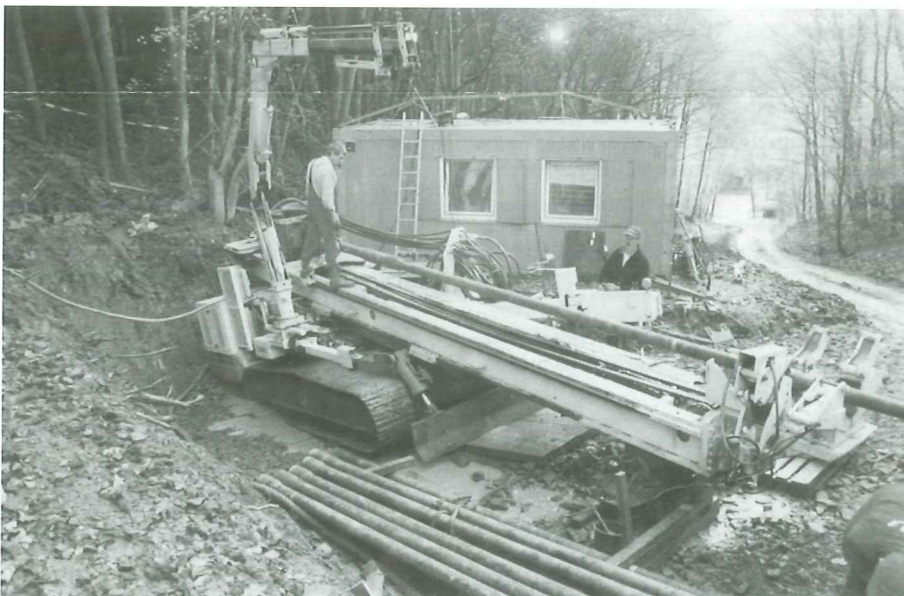
Horizontalbohranlage HRB 206 D40 im Einsatz